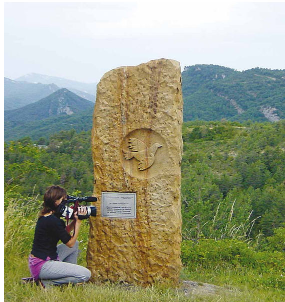
Integrante de Eguzki Bideoak grabando imágenes del monolito en la carretera Igal-Vidángoz / Eguzki Bideoak taldeko partaidea, Igarri-Bidankozeko errepi-deko eskulturaren irudiak grabatzen

ras fascistas, como Italia o Alemania, el final de la dictadura en España no supuso la apertura de un debate público sobre las violaciones de los derechos humanos durante ese periodo, ni tampoco un proceso de compensación hacia las víctimas, un proceso en el que, como se ha señalado en un reciente informe de Amnistía Internacional (2005), el derecho al conocimiento de lo sucedido debe presidir las políticas públicas de la memoria. No sucedió así para el conjunto de las víctimas del franquismo. Las familias de la mayor parte de los desaparecidos han seguido sin saber el destino de sus allegados; y los historiadores se han encontrado con infinidad de trabas