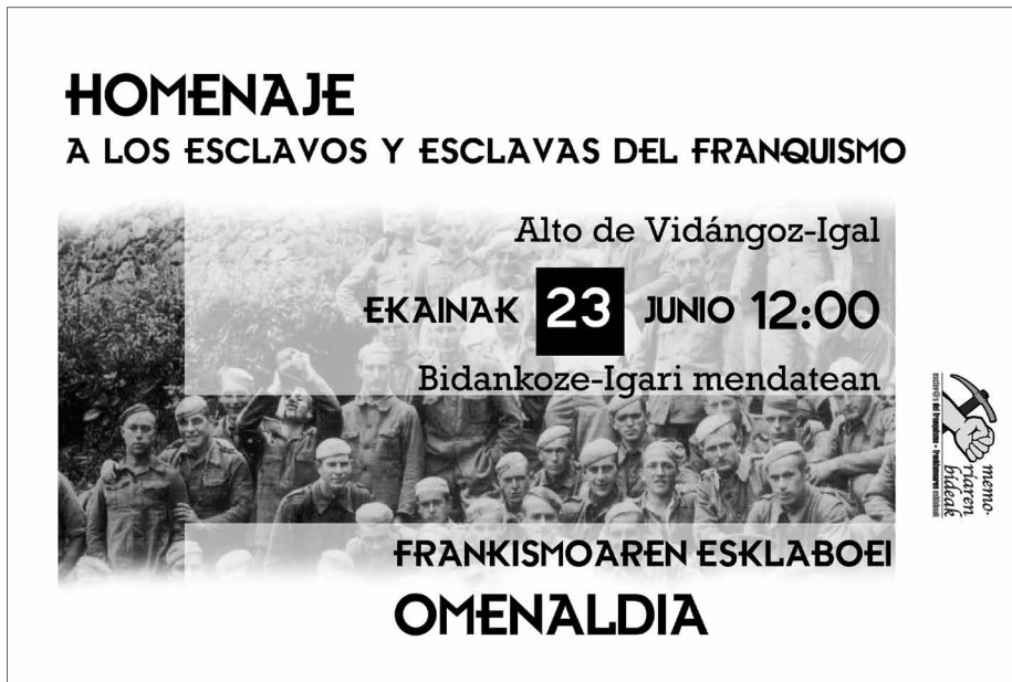
Cartel del homenaje 2007 / Omenaldirako kartela, 2007 Autor / Egile: Manolo Noguerras

son obligadas a trabajar sin ninguna libertad, dentro y fuera de las prisiones.