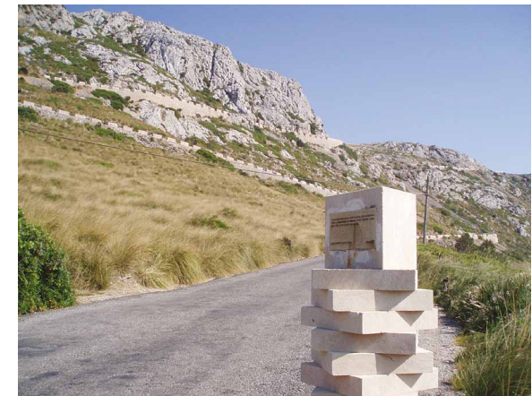
Monumento conmemorativo en Formentor (Mallorca) / Omenezko eskultura Formentorren (Mallorca) Autor / Egile: Nuria Teruel

Memoria Historikoaren Legea deritzonak, momentu honetan lege proiektua baino ez dena, errepresio frankistaren inguruko isiltasunari eusten dio, hori bai, izaera legala emanaz. Kritika ugari jaso du memoria historikoan aritzen diren taldeen eskutik, hala nola, ARMH, Nizkor