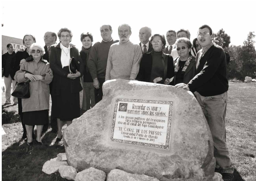
Homenaje a los Presos del Canal en la Universidad Pablo Olavide, Sevilla, 2002 / Ubideko Presoei egindako omenaldia, Pablo Olavide Unibertsitatean, Sevilla, 2002 Autor / Egilea: Lolo Vasco

taldea, edota “Memoria demokratiko eta antifaxistaren aldeko espainiar estatuko herrien eta herritarren manifestua”. Hauetaz aparte, aurtengo martxoan Amnesty International, Human Rights Watch eta Juristen Nazioarteko Batzordeak bezalako taldeen kritikak ere jaso ditu, legea dagoen bezala onartuz gero eskubide zibilen bortxaketak zein gizakiaren kontrako hilketak zigorrak jaso gabe onartzea bailitzateke, mundu mailan horren aitzindari bihurtuz. Epilogo hau egiterakoan, zenbait hobekuntza egin behar direla entzuten da, baina gauza asko daude oraindik ere hobetu beharrean, besteak beste, bortxazko lanei dagozkienez.