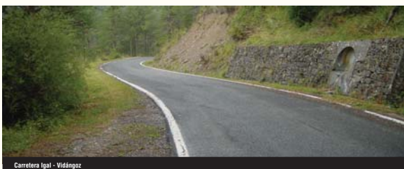
Carretera Igal - Vidángoz

Fueron grandes los beneficios de esta red de trabajos forzados, aunque todavía no hayan podido ser investigados en su totalidad.