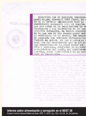
Informe sobre alimentación y corrupción en el BDST 38 Fuente: Andrés Municipal de Vidángoz, 1943, C.P. 103, I.H.C.M. II, de Deñara

El comandante lo teníamos en Roncal. Nosotros teníamos un teléfono, de manivela y cable, y la voz salía muy distorsionada, y podía hablar cualquiera y no sabías quién era. Pues como el Anuncio éste era un putero y se iba a Pamplona cada dos por tres, pues igual no venía a la mañana siguiente, y llamaba el comandante, "a ver, que se ponga Anuncio" y, claro, yo hacía como que iba a buscarle y diga, mi comandante...". yo tenía que hacer eso. Jera un golfo empedernido, que se gastaba todo el dinero!