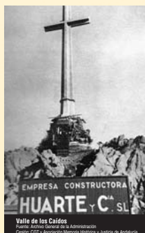
Valle de los Caídos