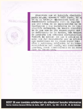
BDST 38 an izandako estelakerari eta elkarlari buruko informazio