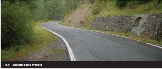
Igori - Bidankoze arteko errepidea

Bortxazko lanen sarearen etekinak ez ziren makalak izan, nahiz eta oraindik erabat ikertuak ez egon.