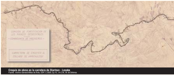
Croquis de obras en la carretera de Olartzain - Lesaka

La construcción de carreteras y fortificaciones fue una de las tareas más frecuentes realizadas en la frontera pirenaica. En las carreteras el trabajo consistía principalmente en la excavación de la caja, a pico y pala, organizados en parejas o en pequeños grupos de prisioneros, y siempre bajo la atenta mirada de los soldados de escolta. La falta de ropa adecuada así como de calzado hicieron todavía más duras las largas jornadas de trabajo, en medio muchas veces de la lluvia y la nieve del invierno pirenaico.