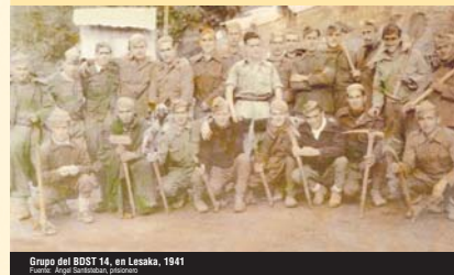
Grupo del BDST 14, en Lesaka, 1941

¡Yo descalzo he pasado las de Dios, descalzo, sin zapatos! Con una manta atada a los pies he ido yo a trabajar. Nos daban calzado, pero el que se quedaba sin ellos así se quedaba. ¡Con el frío que hacía allí! ¡Mecagüen!