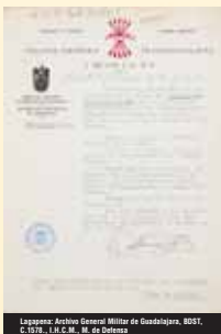
Luzapena: Archivo General Militar de Guadalajara, BST, C.1578 - I.H.C.M. M. de Defensa