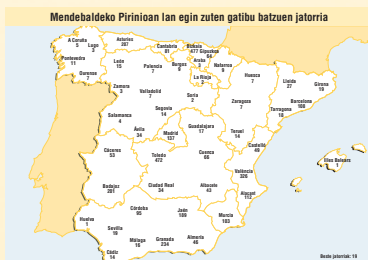
3.411 prisionero hauek BB.TT. 3, 100, 106, 127 zein BST 6, 12, 13, 14, 38etan lan egin zuten edota Iraultza Gogorako Militar Dikapimenteran hiri ziren.