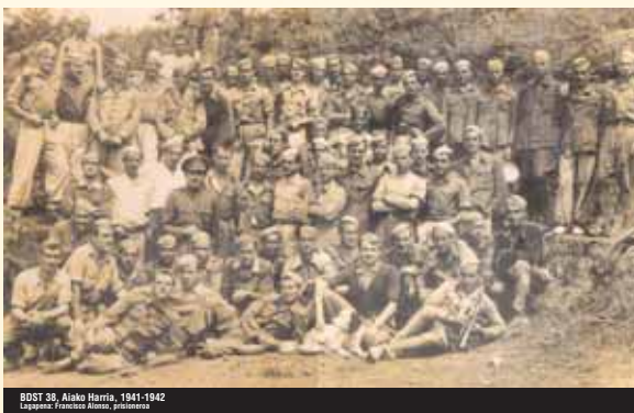
BST 38, Aialko Harria, 1941-1942 Luzapena, Francisco Franco, jainkoak

Jaioterriari begira, leku desberdinetakoak ziren, nahiz eta BSTetan leku bereko gazteak biltzeko joera egon: andaluziarrak 6. BSTean, País Valenciàkoak 12.ean, Mantxagoak 13.ean, Extremadurakoak eta Mantxagoak 14.ean, eta bizkaitarrak 38.ean.