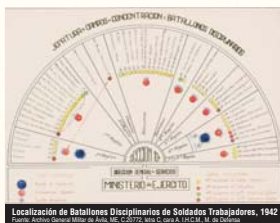
Localización de Batallones Disciplinados de Salados Trabajadores, 1942

Es todavía un reto para la historiografía la elaboración de un mapa con la totalidad de obras y empresas que funcionaron con mano de obra esclava. Aquí se presentan algunos datos, pero todavía faltan investigaciones detalladas provincia a provincia en las que se refleje toda la diversidad de labores realizadas. Este sistema de esclavitud se utilizó en diferentes labores.