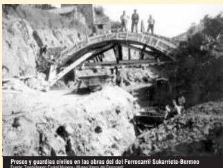
Presos y guardias civiles en las obras del Ferrocarril Sakarrieta-Bermeo

Toda una red de esclavitud, todavía no conocida en su integridad, que fue fundamental para el franquismo de guerra y de posguerra.