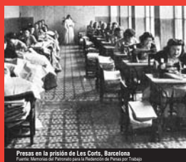
Presas en la prisión de Les Corts, Barcelona