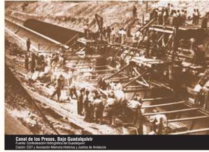
Canal de los Presos, Bajo Guadalupe Fuente: Colección Histórica del Guadalupe Código: C231 - Fundación Memoria Histórica y Democrática de Andalucía

-Trabajo de presos y presas: en 1938 se pone en marcha el Sistema de Redención de Penas por el Trabajo, bajo el que se organizaron los trabajos forzosos de personas ya juzgadas y condenadas. Sobre todo se nutrió de presos y presas políticas, pero presos sociales han continuado redimiendo condena, trabajando para empresas, en diferentes situaciones legales y de explotación, hasta finales del siglo XX. La primera de estas modalidades fue más importante numéricamente, aunque ha sido la segunda la que más tiempo se ha prolongado.