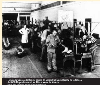
Trabajadores procedentes del campo de concentración de Dachau en la fábrica de BMW-Fremdenwerk in Allach, cerca de Múnich