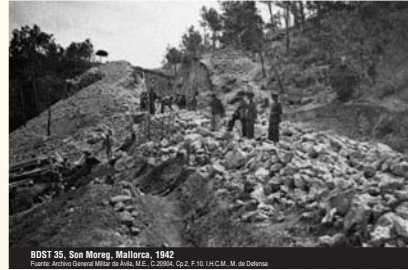
BDST 35, San Mateo, Mallorca, 1942