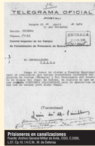
Prisioneros en canalizaciones Fuente: Archivo General Militar de Añón, CGG, C.2303, ES, CP.1.R, I.H.C.M., M. de Defensa

Fuente: P. Preston: "Los esclavos, las alcantarillas, y el capitán Aguilera...", en Muñoz, J., Ledesma, J.L., y Rodrigo, J., (coords.), Culturas y políticas de la violencia. España siglo XX . Ed. Siete Mares