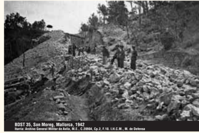
BDST 35, San Morag, Mallorca, 1942