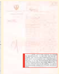
Prisioneroak trenbide lanetan