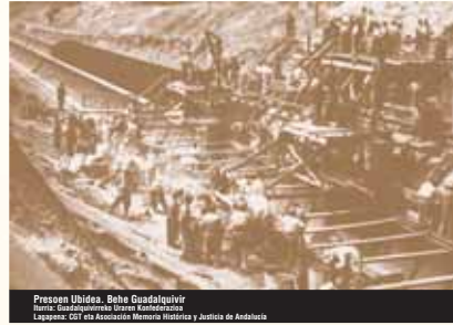
Presoen Uldidea. Behe Guadaluquir

Modalitate hauen artean lehena garrantzitsuagoa izan zen kopuruari begira, baina bigarrenak bizitza askoz luzeago izan du.