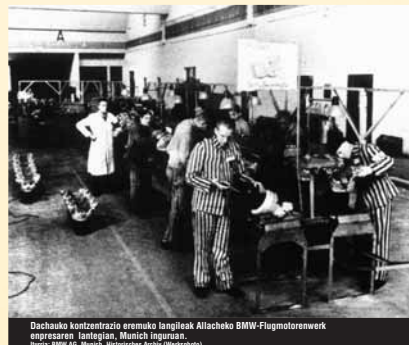
Dachaoko kontzentrazio eremuko langileak Alilacheko BMW-Flugmotoren herri-egintza lanetan